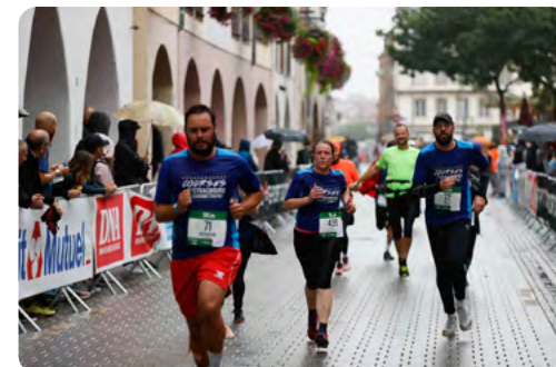
Arrivée des courses Rue des Grandes Arcades