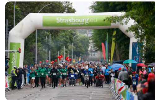
Départ des courses Rue de l'Université

Marche nordique compétition ↳ Épreuve officielle dans le Parc de la Citadelle