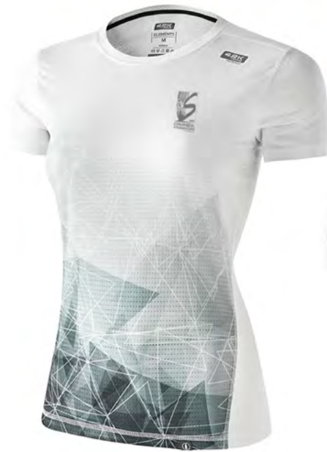
T-shirt des Courses de Strasbourg 2022 - Modèle femme