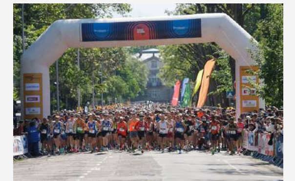
Départ des courses Rue de l'Université

Marche de l'Europe avec ou sans bâtons Marche nordique compétition épreuve officielle dans le Parc de la Citadelle