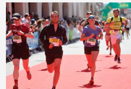
Arrivée des courses Rue des Grandes Arcades